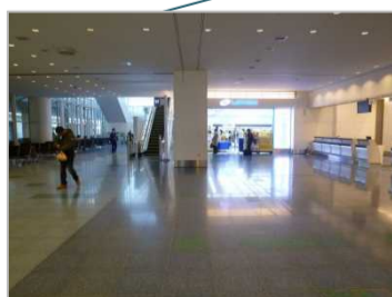
エントランスプラザ (コンビニ前)