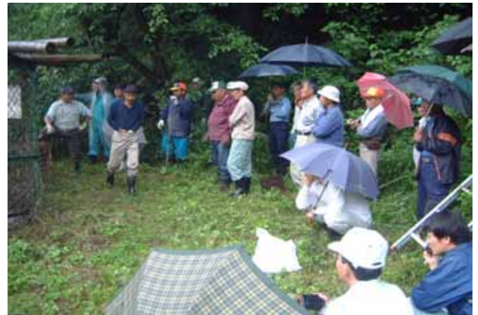
H16.6.13 イノシシ資源化研修会(囲いワナに集まる駆除班員)