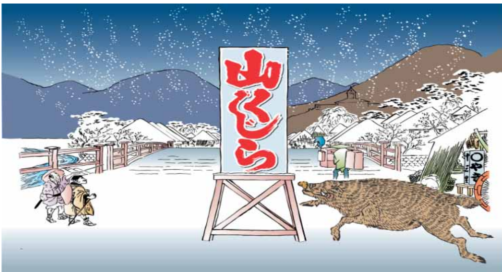
「山くじら」といえば美郷町、美郷町といえば「山くじら」と言われるような地域ブランド創出に向けて町が商標登録認証(H17.11.4)の 絵図 H17.1.28 出願

町全体を上げての取り組み (有機農業の推進・ツーリズム・宿泊施設の参画・人と自然の共生)