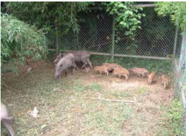
H16.7.29 囲いワナに捕獲されたイノシシ