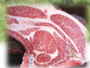
最高級牛肉の断面