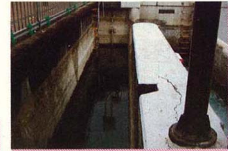
東西分水工【コンクリート壁のひび割れ状況】