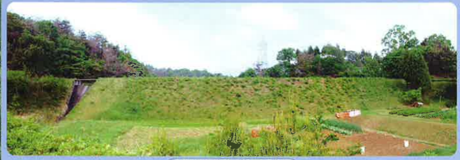
ため池(馬の背調整池)