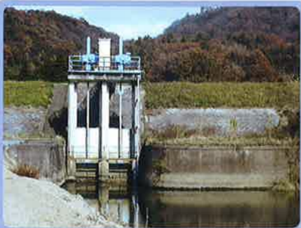
右岸頭首工取水口