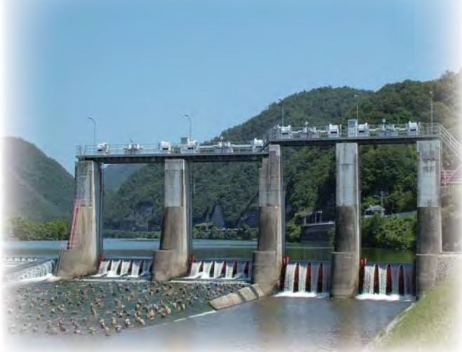
高梁川合同堰（改修済）