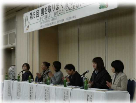
パネラーの皆さん

この「情報交流の広場」は、食や農に関心がある方々の意見交換の場として開催したもので、一般公募で生産者や主婦をはじめとする消費者のほか、消費者団体や農業関連団体の関係者等約100名が参加しました。