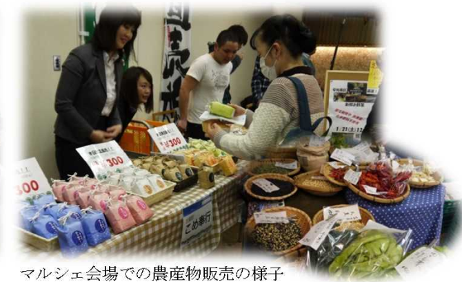
マルシェ会場での農産物販売の様子

同時に開催されたマルシェでは、生産者が自慢の農産物を直接展示販売しました。訪れた方は新鮮な地元産農産物を手に満足そうな表情でした。