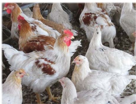
肉用讃岐コーチン

一般のブロイラーの飼育期間は約50日ですが、75～90日の長期間、平飼いによって十分に運動ができる環境で育てられる讃岐コーチンは、心地よい噛みごたえ、じわっとにじみ出る豊かな肉汁とコクのある旨みが特徴です。また、イミダゾールジペプチドと呼ばれる抗疲労物質も多く含まれており、ヘルシーな鶏肉として人気があります。現在は、年間約5万羽が生産されています。