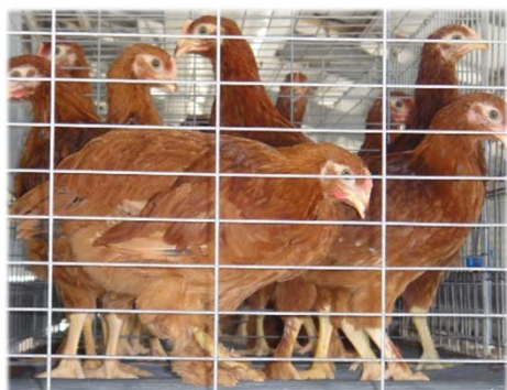
卵用讃岐コーチン