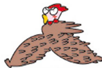
讃岐コーチンイメージキャラクター 「ヘルシーちゃん」

讃岐コーチンは、県内のスーパーや小売店を中心に販売されているほか、飲食店等でも提供されています。皆さんも、香川の誇る「讃岐コーチン」をぜひ味わってみてください。