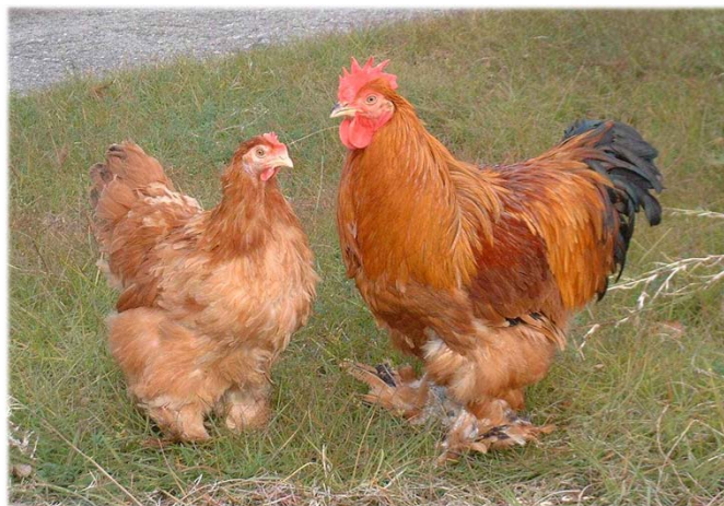
讃岐コーチンの種鶏