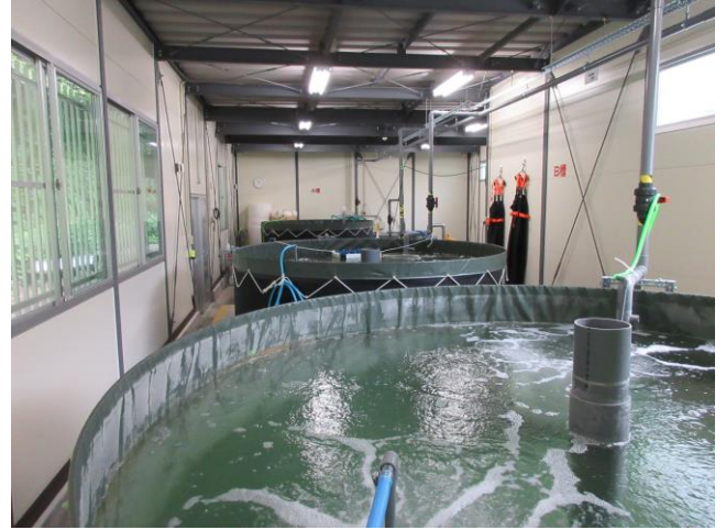
マイントピア別子内の養殖施設

同社では、技術先行する会社での研修や研究を重ね、平成28年3月、観光施設マイントピア別子敷地内に容量5.6tの水槽4基を備えた施設を建設しました。養殖水は、温泉水に塩分を混ぜて人工海水を造り、炭やサンゴでろ過して飼育期間である約1年間循環させて使用します。