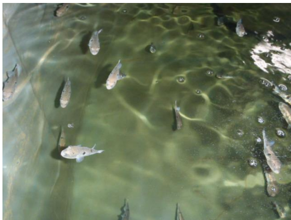
群れをなして泳ぐ体長5～7cmの稚魚

6月29日に先行テストとして稚魚20匹、7月6日に337匹を放流し、平成29年1月には350匹を追加放流する予定です。訪れたこの日も、餌をやると飛び跳ね、群れをなして勢い良く泳いでいました。