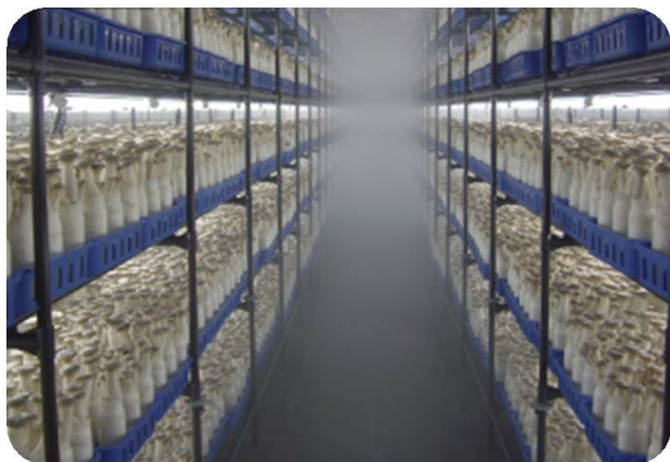
秋の環境が再現された生育室

同社のきのこセンターは全国19カ所にあり、培地の製造から種菌の植え付け、培養、収穫