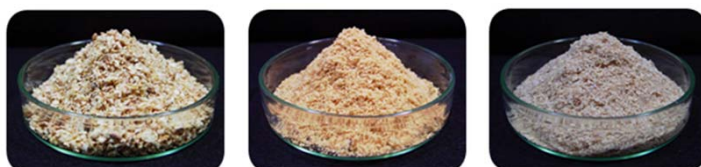
コーンコブミール