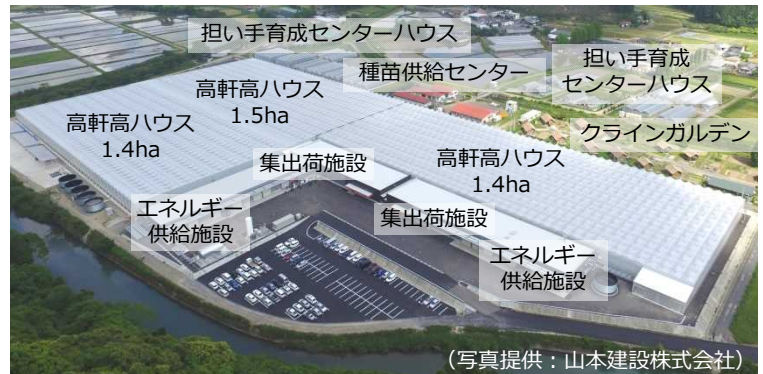
完成した次世代施設園芸団地

高さ6メートルの高軒高ハウス3棟、総面積は4.3haで、これは、農林水産省が全国10箇所で展開している「次世代施設園芸導入加速化支援事業」で最大です。