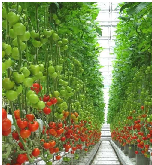
参考：三原村で栽培している「有限会社四万十みはら菜園 本社」の施設内

また、加温は県産のおが粉を燃料とした木質バイオマスボイラーで行い、化石燃料の大幅な削減に繋げていきます。