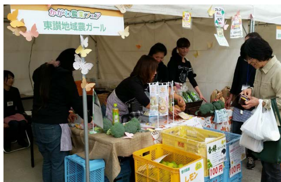
かがわ農業フェアに出展

同プロジェクトでは、今後もメンバーの意見や要望を踏まえながら活動の輪を広げていく予定です。農業に携わる東讃地域の女性の皆さん、同プロジェクトに参加してみたいはかがですか。