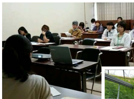
研修・農場視察 の様子

https://www.facebook.com/eastareanogirl/