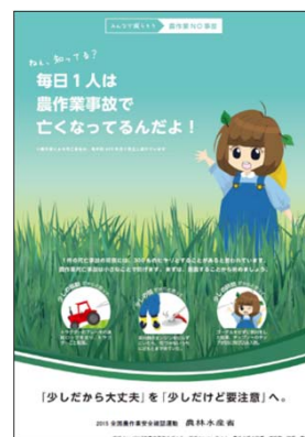
2015年度 農林水産大臣賞受賞作品