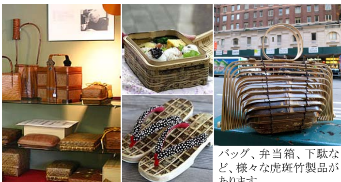
バッグ、弁当箱、下駄など、様々な虎斑竹製品があります。