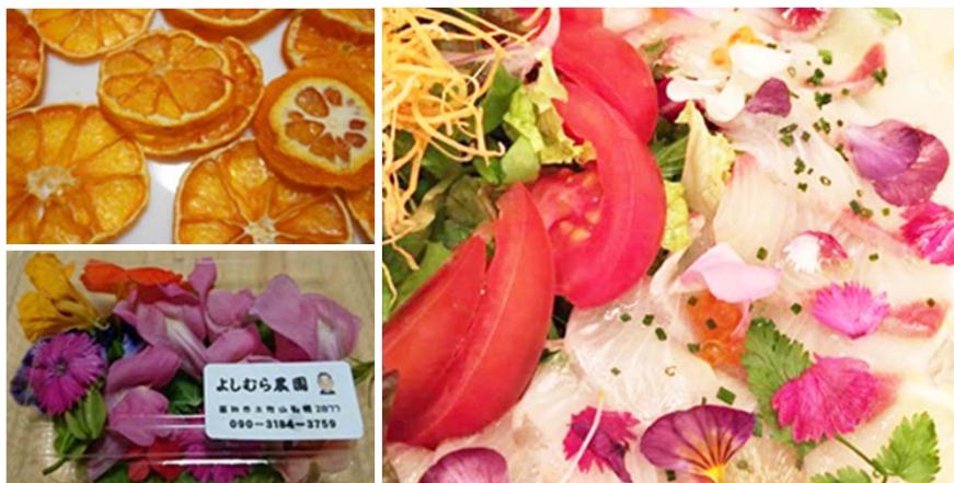
食用花と乾燥みかん