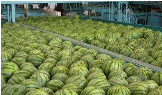
(JA鳥取中央大栄スイカ選果場)

この作業員不足を解消する取り組みはらっきょうの集荷から始まり、スイカ、梨、米と続きます。作物によっては作業時期が重なる場所があり、