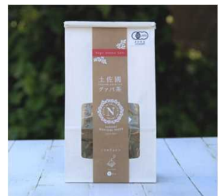
(有機土佐国グァバ茶)