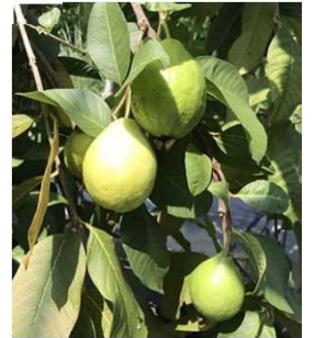
(幻のフルーツ、グァバ)

高知市の東に隣接する南国市で、農薬・肥料を使用せず自然栽培にこだわる「エンジェルガーデン南国(南国にしがわ農園)」は、2018年7月、グァバ生産加工で6次産業化の認定を受けました。また、障がい者の働きがいのある農園を目指した農福連携にも取り組んでいます。