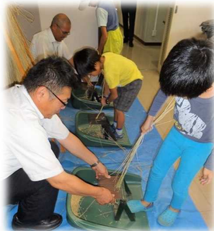
子ども達で脱穀体験！