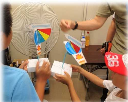
手作りの風力計で風を見る

行政相談コーナーでは、行政相談マスコット「キクーン」と一緒に、自分達ができる行政相談について学習したよ。