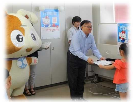
修了証書をもって学習終了