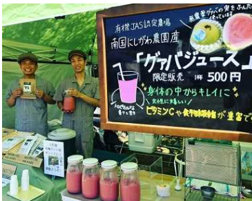
(オーガニックマーケット)

また、2020年東京オリンピック・パラリンピックに向けて、食への関心が高まることも予想され、この度、6次産業化の認定を受けることとなりました。