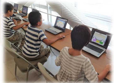
クイズで農林水産業を知ろう！