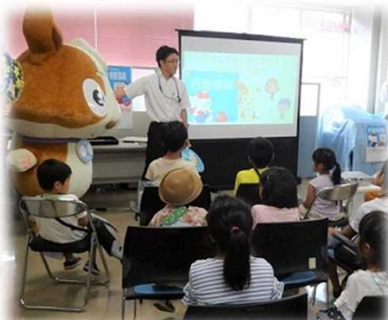
行政相談ってなんだろう？