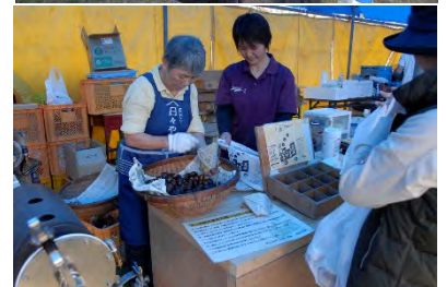
(ふるさとまつりへの出店)