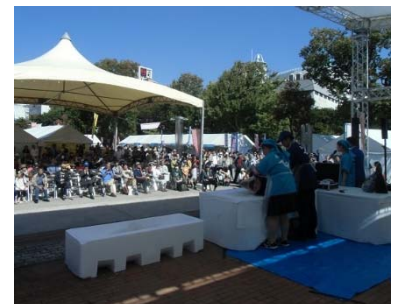
(イベントでの解体ショー)