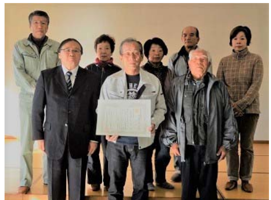
入河内大根のこそう会

12月13日に訪問した「株式会社サンビレッジ四万十」は、高知県初の「1集落1農場」方式による集落営農組織をスタートに、経営の複合化を図り人材育成と雇用の創出に取り組んでいます。また、ソーラーシェアリング、渡り鳥のえさ場とする冬季湛水、農道への梅の木の移植など多面的機能の増進にも取り組んでいます。