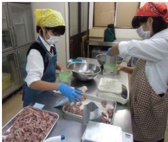
(子供たちによる試作品開発)

現在、県内で唯一本マグロの養殖に取り組む大月町では、4軒の事業所が養殖本マグロを生産し、国内3位の生産量を誇ります。本マグロ産地としての知名度向上や、交流人口の増加を図るため、平成29年に「マグロのまち大月推進協議会」が設立されました。