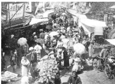
(昭和初期の日曜市)