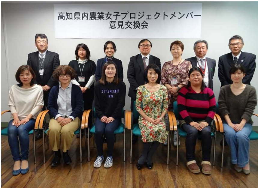
高知県内農業女子プロジェクトメンバー 意見交換会

こういった商品開発の話をもとに、どのように企業につなげるかなど、白熱した議論が交わされました。