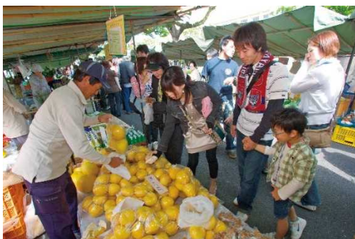
(人情味あふれる土佐弁も魅力のひとつ)

平成30年度には、「れんけいこうち日曜市スタンプラリー」として、県内各市町村から出店されている店8店舗を巡り、スタンプを集めて景品に応募するなど新しい取り組みも行いました。