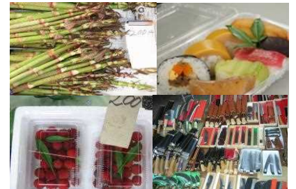
(イタドリ・田舎寿司 やまもも・打ち刃物)

なお、毎年秋頃に市内の未就学児に100円の「おかいもの券」を贈り、小さい頃から慣れ親しんでもらう取り組みもしています。