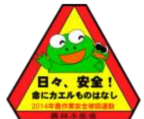
2014年春の 農作業安全確認運動 農作業安全ステッカー

http://www.maff.go.jp/j/seisan/sien/sizai/s_kaikai/anzen/index.html