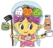
取り組もう！6次産業化

中国四国農政局は、3月31日「六次産業化・地産地消法」に基づき、平成25年度第3回「総合化事業計画」3件の追加認定を行いました。累計では「総合化事業計画」188件、「研究開発・成果利用事業計画」3件となっています。