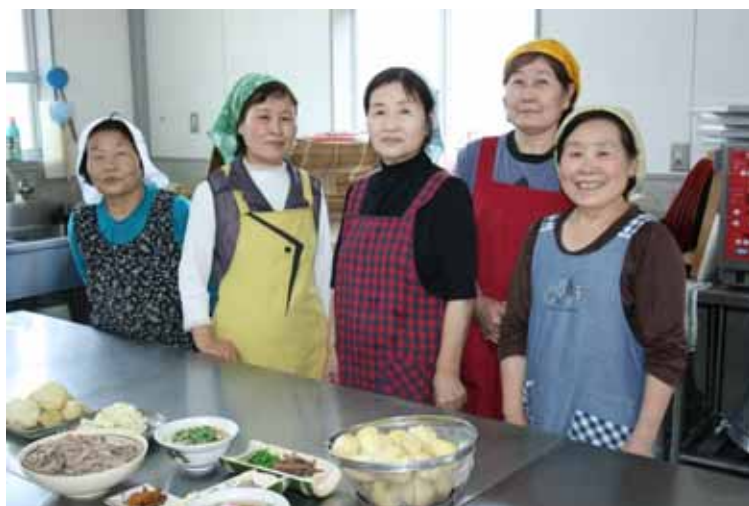
つるぎ町生活改善推進協議会一宇グループの皆さん