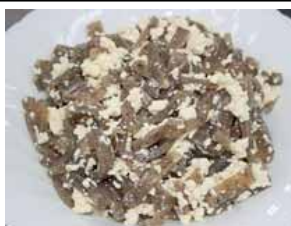
こんにゃくの白あえ