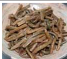
ぜんまいのごま油和え