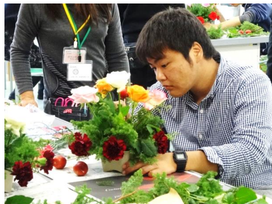
▲クリスマス向けアレンジメントに挑戦

「花育」は、平成22年から継続して実施している就実短期大学のほかに4校で取り組んでおり、同委員会から