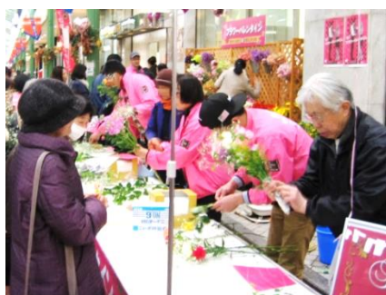
▲オリジナル花束のプレゼント

平成26年からは、バレンタインデーに男性から女性に花を贈る欧米等の習慣にならった花き業界の統一キャンペーン「フラワーバレンタイン」を開催しています。バレンタインデーが「花を贈る2月14日」として心温まる一日になるように、県内産の花き（スイートピー、トルコギキョウなど）を使ったオブジェの展