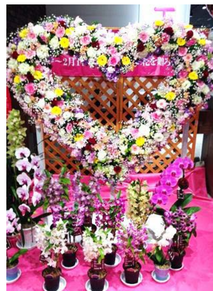
▲フラワーバレンタインのオブジェ

同委員会は、「今後も、より具体的な提案ができるように新商品の開発に取り組んでいきたい」としており、今後の更なる広がりが期待されます。