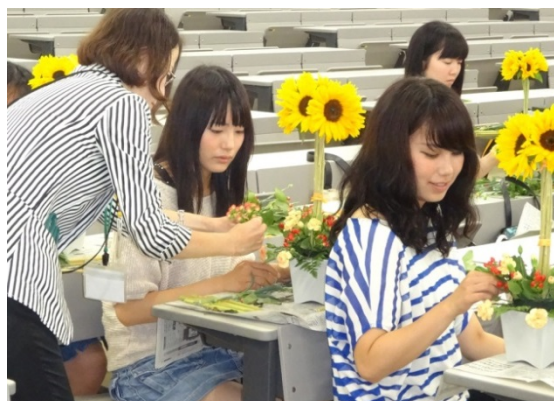
▲フラワーアレンジメントの作成

参加した学生からは、「花があることで家の明るさが違うんだなと思った。」「将来、教育現場で、花を育てることは命を育てるのと同じだということを伝えたい。」等の感想が寄せられています。