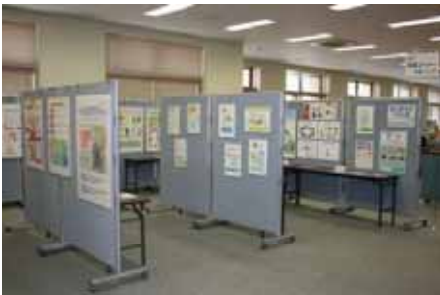
平成25年パネル展会場の様子