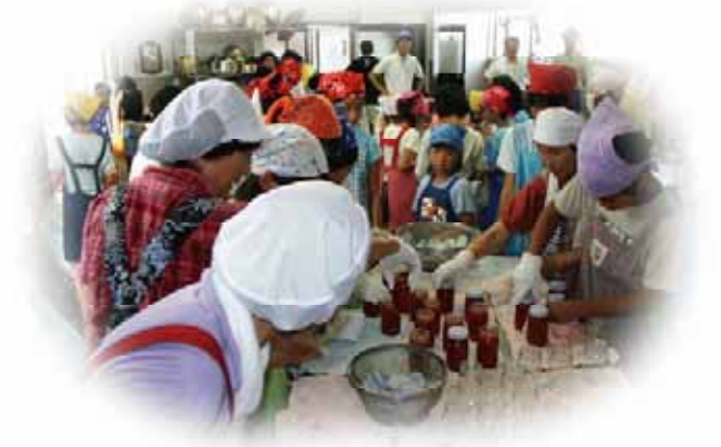
(郷土の食材を使った料理教室)