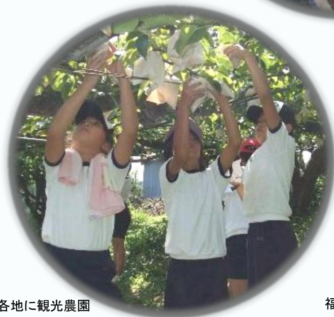
県下各地に観光農園