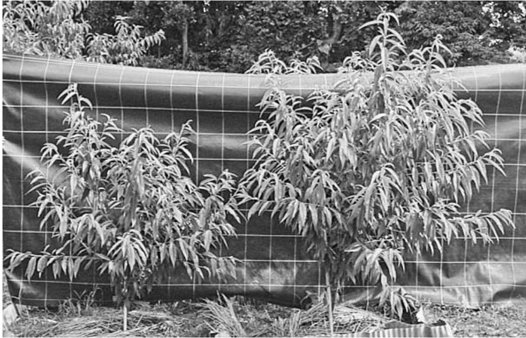
図3 エタノール・木質系活性炭併用 処理した苗木の生育 (定植1年目7月)