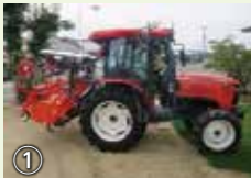
① [作業機の詳細] ・超碎土成型ロータリー(上面マルチキット仕様) ・GPS車速連動施肥機

導入技術 ①直進アシスト機能付きトラクターを利用した圃場準備の多工程同時作業 ②GNSS自動操舵 乗用型防除機による省力防除