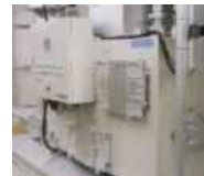
木質ペレット加温機