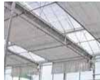
内張被覆の多層化