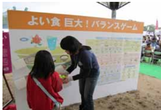
(ボールをシーソーに乗せます)

同フェスティバルは、広島の秋の恒例イベントとして定着しており、会場である広島城址及び中央公園近隣には、2日間で74万人の来訪者があり盛況でした。体験型学習ブースで行った「よい食巨大! バランスゲーム」は、自分の摂った食事の量をボールに置き換え、シーソーに乗せてつりあいを取る「食事バランスガイド」を活用したゲームです。体験した親子連れからは「うまくバランス取れない」などの声上がり、終始賑わっていました。