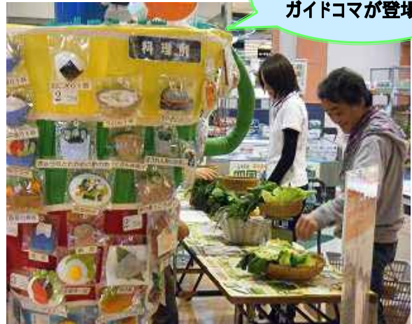
(野菜350gあてコーナー)

人気は「食事診断」で、本物そっくりの食品サンプルの中から、昨日食べたものを選びセンサーボックスに乗せると、瞬時にエネルギーや塩分などの摂取結果が出てきます。結果に沿って相談や指導を行い、子どもや男性にも人気で長い行列ができました。