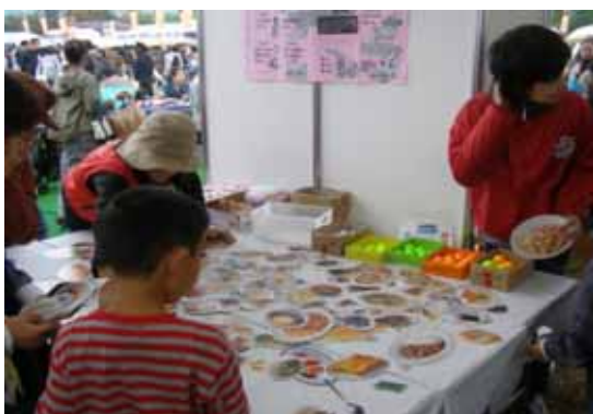
(摂った食事をカードで選びます)

シーソーがつりあう方は少数でしたが「食事バランスガイド」による食生活改善や日本型食生活への見直しのきっかけにつながることを期待されます。