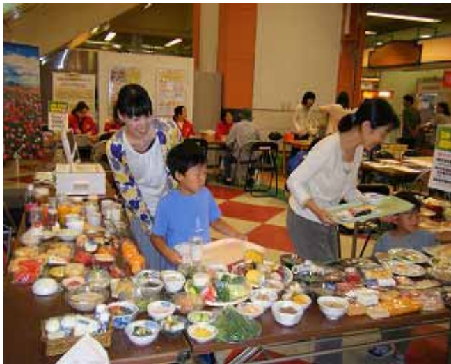
(昨日食べたものは何だったかな~?)

相談では糖尿病や高血圧に関するものが多く、食べ方や体を動かすことなどの生活習慣がいかに大切かを受けとめて頂きました。このような、買物ついでに立ち寄れる食育コーナーや相談会は、食生活について日ごろ関心のない方にも興味を持って頂くことができる良い機会となりました。