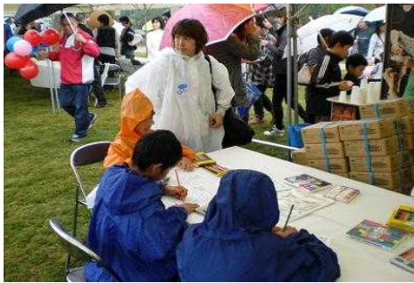
松山地域センターブース

会場には、参加団体のブースが並び来場者は新鮮な地元農産物などお目当てのブースに長い列を作っているやかな会場となりました。