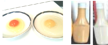
左:恋たま 右:米たまご

2種類のたまごの素材を活かした調味料を開発することで、こだわりのたまごのブランド化と販路拡大を図る。