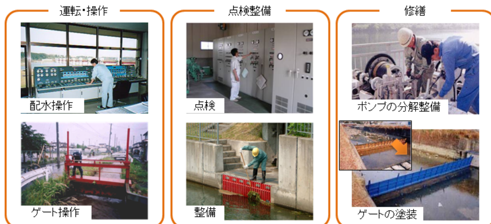
図2. 農業水利施設の管理の内容