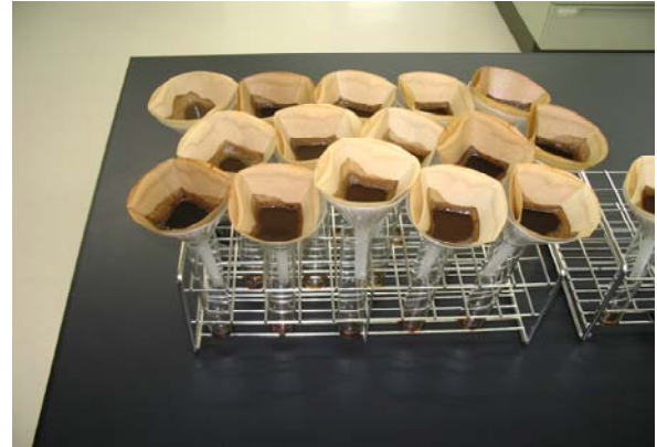
土壌サンプルの調整

分析データ管理用コンピュータで、対象作物にあった土壌改善対策や、施肥設計案等の営農情報を作成。