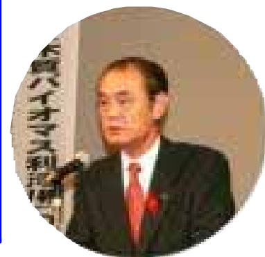
【井口南魚沼市長のあいさつ】