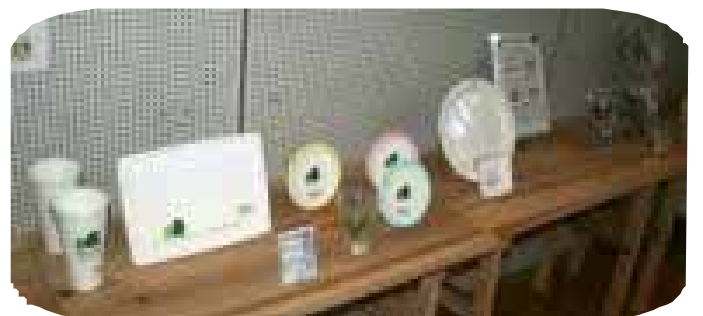
愛・地球博で使用されたバイオプラスチック製品など