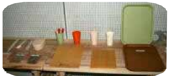
間伐材・古々米からできたバイオプラスチック製品