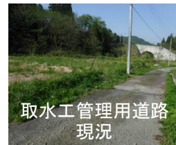
取水工管理用道路現況