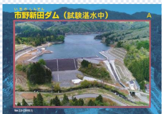
市野新田ダム(試験湛水中)

市野新田ダム試験湛水時(満水時)のダムカードを作成します。栃ヶ原ダム、後谷ダムのダムカードについても、この機会に一新します。配布場所等詳細につきましては、随時当事業所ホームページに掲載しますので、是非チェックしてください。