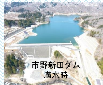
市野新田ダム満水時

本年2月5日より開始した試験湛水は約50日間の満水位保持期間を経て、5月13日より徐々に水位を降下させ、6月11日に、無事最低水位に到達しました。今後、試験湛水期間中に継続観測したダムの挙動を詳細に整理・分析し、有識者等で組織されるダム技術検討委員会に諮った後、河川管理者の完成検査を経て、正式な工事の竣工を迎える見通しです。また、それまでの間のダムの貯水水位は、最低水位での管理とし、完成検査後、徐々に水位を上昇させ、R2年度春からの供用開始に備える予定です。なお、来年4月から、市野新田ダムの管理は、柏崎土地改良区に引き継がれます。