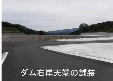
ダム右岸天端の舗装