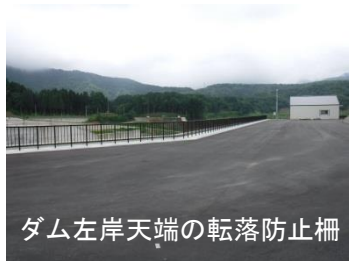
ダム左岸天端の転落防止柵

送り梅雨のみぎり、市野新田ダムでの工事も終盤を迎えています。試験湛水も経過は順調で6月中旬に最低水位まで降下させたところです。現在は転落防止柵、進入防止柵の設置等、周辺整備を進めています。併せて、これまでの土工事で発生した残土の受入地を最終整備しているところです。平成24年度より実施してきましたダム工事も本年度9月末にはこれら全ての工種を終え、完成する予定です。この間周辺の皆様には多大なるご協力をいただきましたこと感謝申し上げます。今しばらくのご協力をよろしくお願いたします。