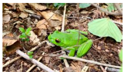
木陰に涼むモリアオガエル(女谷地内)