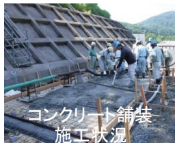
コンクリート舗装施工状況

昨年度、市野新田ダム右岸付替道路の大部分の舗装とガードレール設置工事を実施しましたが、残りの部分と左岸付替道路につきましては、本年6月より本格的に工事を進めています。コンクリートミキサー車を始めとした資機材運搬車両が、しばらくの間女谷集落内を通ります。ダム工事同様、安全運転を徹底しますので、ご理解のほどよろしくお願いいたします。