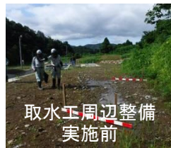
取水工周辺整備実施前

市野新田取水工までの管理用道路のコンクリート舗装や、取水工からダムへの導水路が通っている市道のアスファルト舗装復旧を行う工事です。7月から順次工事を進め、11月末には完成する予定です。工事実施に伴い、ダム近くの市道や市野新田集落内において片側交互通行等の交通規制を行う場合がありますので、ご理解ご協力のほどよろしくお願いいたします。