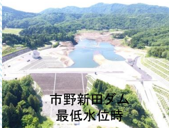
市野新田ダム最低水位時