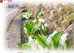
雪どけを告げる水芭蕉(女谷地内)

また、今年12月にはダムに水を貯めて安全性を確認する「試験湛水」を開始する予定です。期間は約半年を見込んでいますが、河川管理者や学識経験者等の意見を踏まえて慎重に進めていきます。ようやく出現するダム湖を是非ご覧下さい。