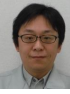
いたる 至 やたべ 谷田 部