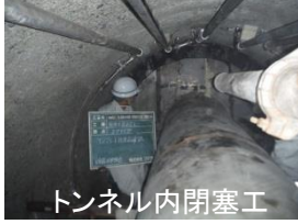
トンネル内閉塞工