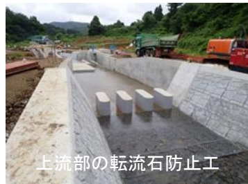
上流部の転流石防止工