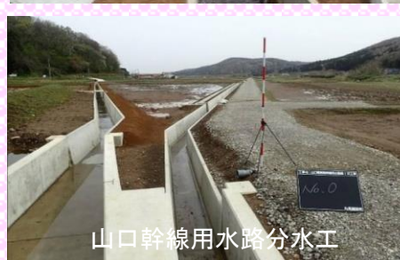
山口幹線用水路分水工