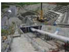
取水設備の工事状況