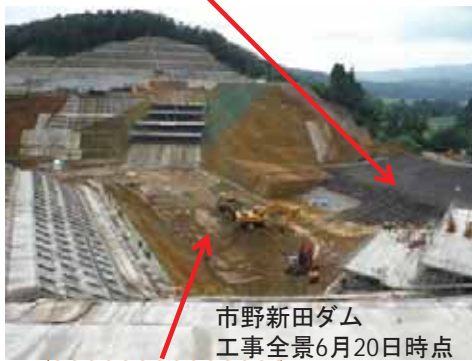
市野新田ダム 工事全景6月20日時点