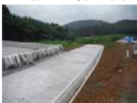
棚入林道の舗装状況