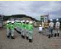
市野新田ダムを見学した生徒たち

5月23日(月)に、JICAの技術協力の一環としてアフガニスタンから来日した研修生11名が後谷ダム、藤井頭首工、市野新田ダムを見学しました。研修生らは日本の農業の特色に沿った、数々の農業水利施設に衝撃を受けていたようでした。 未来の農業を支える若者たち 6月16日(木)に、上越市の高田農業高校3年生39人が市野新田ダムを見学しました。生徒からは、生の工事現場を自分達を目で直接見て、教科書では分からない土木工事現場に対するイメージが変わったとの声も聞かれました。 ※現地見学会のご希望がございましたら、柏崎周辺農業水利事業所までご連絡ください。(0257-24-5731)