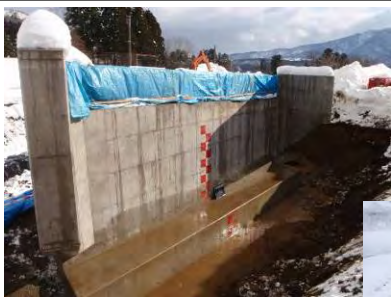
1号橋梁右岸橋台 H24年1月

発行元 北陸農政局 柏崎周辺農業水利事業所 柏崎市南半田18番15号 TEL:0257-24-5731 バックナンバーはこちら http://www.maff.go.jp/hokuriku/koukuei/kashiwa/index.html