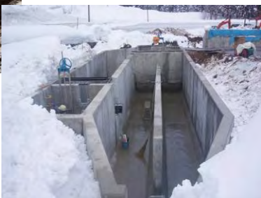
第2水利組合沈砂池 H24年1月

1号橋梁下部工他工事 現在、第2水利組合沈砂池及び1号橋梁右岸橋台が出来上がりました。今後は、左岸橋台及び護岸工を施工し、24年3月に完成予定です。