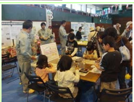
子供たちによるガラスの絵付け

昨年10月20日に開催された柏崎 農業まつりに当事業所も出展しま した。事業内容を紹介するパネル やパンフレット、後谷ダム周辺に 生息する魚(ヨシノボリ等)を展 示するとともに、来場した子供た ちの後谷ダムの万灯会で使用す るキャンドルグラスに絵付けをし てもらいました。このキャンドルグ ラスは今年の夏の万灯会で使用し、 子供たちの絵とともに夜の後谷ダ ムを照らす予定です。