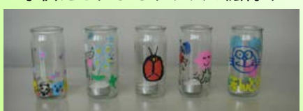
絵付けされたキャンドルグラス