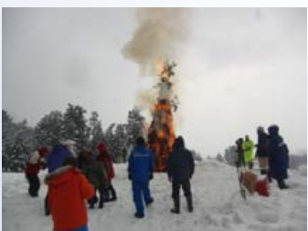
上野集落の賽の神の様子

1月13日、15日に女谷地区と市 野新田地区で開催された賽の神 (どんと焼き)に事業所職員も参 加しました。当日は時折雪が舞う こともありましたが、稲わらに火 がつけられると勢いよく燃え上 がり、雪の白色と炎の赤色で幻想 的な雰囲気の中、皆で無病 息災や家内安 全とともに地 域の発展を祈 願しました。