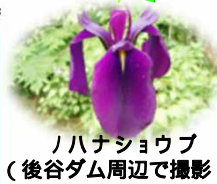
ハナショウブ (後谷ダム周辺で撮影)

<発行元> 北陸農政局柏崎周辺 農業水利事業所 柏崎市南半田18-15 TEL: 0257-24-5731 ホームページは