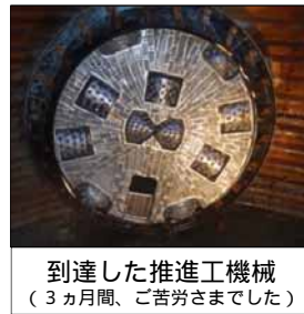
到達した推進工機械 (3ヵ月間、ご苦労さまでした)

市野新田ダムと市野新田取水工をつなぐ導水管を埋めるために、埋設区間の伐開と掘削を8月から、市道132号線に掛かる区間の施工を予定しております。