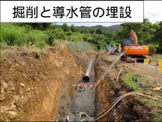
掘削と導水管の埋設

市野新田ダムと市野新田取水工をつなぐ導水管を埋めるために、埋設区間の伐開と掘削を8月から、市道132号線に掛かる区間の施工を予定しております。