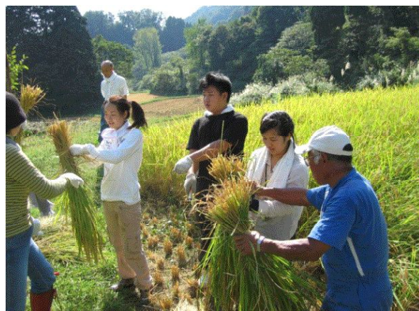
写真2 学生による稲刈り