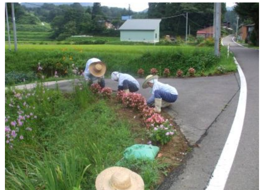
写真4 集落内の環境美化活動

中山間地域等直接支払制度を契機に作成した石谷集落活性化プランに基づき、石谷集落によって石谷公園の管理を行っている。