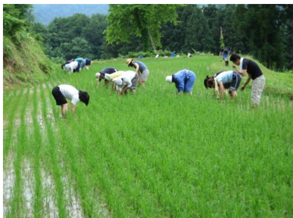
写真1 学生による田植え

営農を中心とした話し合いを重ねる中で、法政大学人間環境学部のフィールドスタディの受け入れを旧吉川町が受諾したことを受け、集落としても地域の活性化が期待できる取り組みとして協力することを決定した。地区の祭りなどで他集落とも連携しながら、交流を深め、現在では年間をとおした交流活動に発展している。