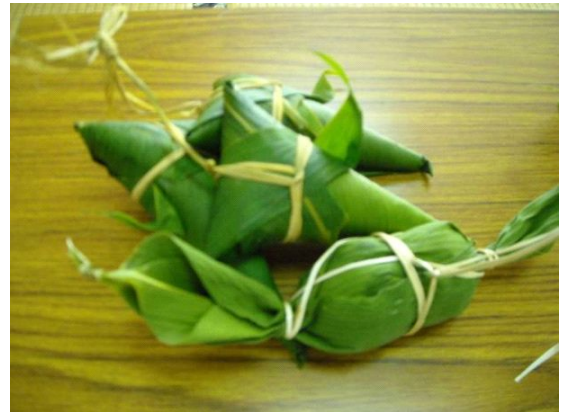
写真5 地域の特産品（ちまき）