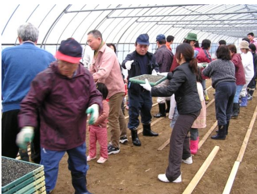
写真3 塾生による苗の搬入作業

さらに、この6年間の地道な活動の積み重ねにより、参加者が市谷米を定期的に購入するようになったり、金沢市郊外の農業体験グループより営農指導の依頼が舞い込むなど、新たなビジネスチャンスへと展開している。