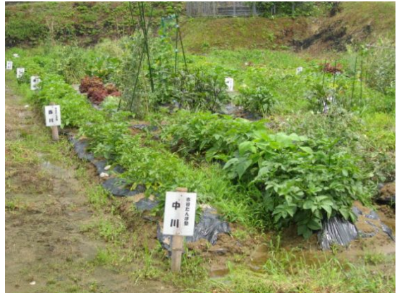
写真2 「市谷たんぼ塾」屋外体験ファーム

集落営農組織が中心となって都市農村交流行事を行うことは県内初の取り組みで、これには、金沢市や津幡町内から毎年15組以上の非農家が入塾し、現在まで延べ200名以上の都市住民が米や野菜作りを体験しながら、農業・農村に対する理解を深め、中山間地の棚田風景が、そこに暮らす人々の努力によって守られていることを学んでいる。また、平成21年の収穫祭では、新米と古米の食べ比べを行うなど、活動が定例的にならないよう、常に新しい要素を入れながら取り組みを行っている。