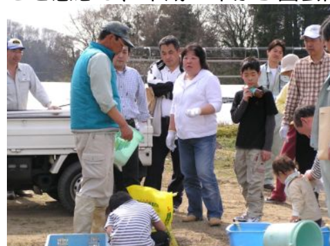
写真4 営農指導を行う営農組員

市谷集落では、営農組織による水田農業の展開により、従来個別経営において重要な役割を果たしていた女性・高齢者の活躍の場が減ることを懸念し、平成10年から園芸品目のハウス栽培を行っている。栽培に当たっては、農業高校で技術指導を行っている営農組織の役員が品目の選定や生産技術指導、コストシミュレーションを行い、複合部門の経営安定化を図るとともに、得られた利益は現金収入として還元させることで働く意欲に結びつき、継続的な活動として定着している。この事例のように、市谷集落には多様なノウハウや経験をもった構成員が多数存在し、適材適所で活動に参加している。営農組織の労務管理は会社で労務管理を担当している人が行っているほか、役場職員やJA営農指導員が会計事務や情報収集機能を担っている。これにより、他の集落営農でみられるような労務費の無駄や栽培管理の失敗もなく、補助事業の活用も迅速に行われている。