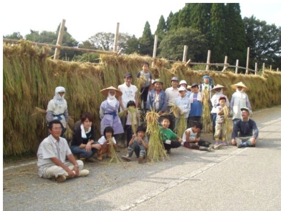
写真1 子供たちも参加してのはさ干し作業

野菜はJAを通じて津幡町・かほく市の学校給食や仲卸業者へ出荷されるほか、Aコープ産直コーナーで販売されている。