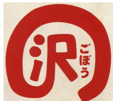
写真2 ロゴマークの商標登録

また、沢野ごぼう事業協同組合では、沢野ごぼうのブランド化を推進するため金沢大学の学生に協力をしてもらい、商標登録やホームページを作成した。一方、沢野ごぼう事業協同組合の組合員には金沢大学より里山駐村研究員の委嘱を受け、里山研究に協力している者もいる。