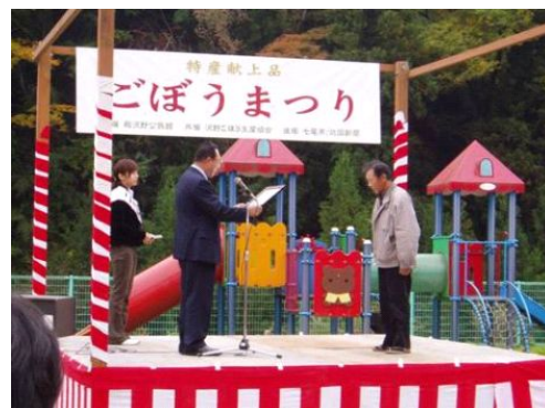
写真1 沢野ごぼうまつりの開催

沢野ごぼう事業協同組合ではグリーンツーリズムによる都市交流にも取り組んでおり、体験交流施設を拠点に、旅行業者と共同でツアーを企画し、外国人や都市住民を招き入れ、ごぼうの播種体験及び収穫体験を実施したり、農家レストランにて、ごぼう料理を提供している。また、沢野ごぼうのブランド化を推進するため、ロゴマークを作成し、商標を取得した。この商標は、沢野ごぼうの商品やPRパンフレットにて活用している。また、平成19年にはホームページを立ち上げ、沢野集落や沢野ごぼうの魅力を紹介している。