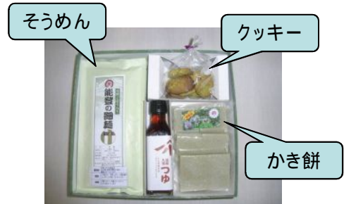
写真3 沢野ごぼうギフトセット

素麺の原料となるごぼうの葉の生産は、沢野集落だけでは不足したため、渓流沿いの近隣集落に依頼した。ごぼうの葉の収穫作業は、ごぼうの根の収穫作業と比較して、軽作業であるため、条件不利な中山間地の新たな収入源として、近隣集落の高齢者に喜ばれている。さらに、近隣集落の女性加工グループと連携し、ごぼうの葉入りクッキーや切り餅の商品化も行い、周辺集落も巻き込んだむらおこしに発展している。