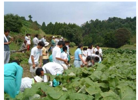
写真4 ごぼうの収穫体験

沢野ごぼうを核にしたむらおこしに取り組む中で、七尾市街地の住民との交流が活発になり、ボランティアがごぼう畑の草むしりやグリーンツーリズムを手伝うようになっている。グリーンツーリズムには、県内外の住民が訪れ、さらに旅行業者と連携して外国人の受け入れを行っている。平成20年には、約400人の外国人が訪れ、日本の古き良き農村文化を体験している。