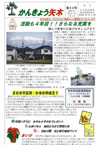
写真5 広報「かんきょう矢木」

「子どもたちに素晴らしい環境をプレゼントします」を合い言葉にみんなで楽しく活動している。また、環境委員会として、親子で参加するワークショップや研修会を開いて、各地に視察研修を実施している。このような活動の結果、農地だけでなく農道や用排水路等農業用施設についても、地区全体で管理する体制が整った。