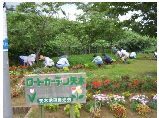
写真6 ロードガーデン矢木

当地区は、砺波市の中心部にあることから、今後、新興住宅地化がさらに進展することも予測されているが、このような混住化の中での環境保全活動が、農家のみならず非農家の住民を含めた地域への愛着を深めている。地域への愛着は、(農)矢木営農21婦人部を中心に、PTA活動の一環として、地区内にある「ロードガーデン矢木」には季節の花を植える活動にも結びついている。