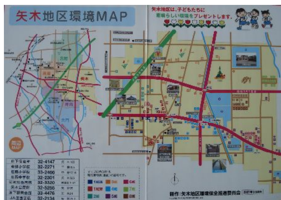
写真4 矢木地区環境MAP

環境保全活動の内容をビデオに撮り、編集して住民に貸し出しを行い、未参加の住民に対するの参加啓発に役立っている。