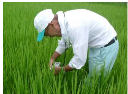
写真 1 葉緑素計を使った肥培管理

栽培技術の高位平準化を図るため、組合長が直接個々の農家に指示するのではなく、元生産組合長が組織する「ほ場見回り隊」による適期の巡回指導を実施した。その場で葉緑素計を使って診断し、ほ場や品種毎に肥培管理や水管理を徹底した。これにより、適正な穂肥施用や適正な水管理がなされるようになり、(農) 矢木営農 2 1 の収量・品質が改善され、経営内容も改善された。