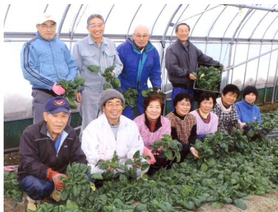
写真3 女性部中心の「寒締めハウレンソウ」