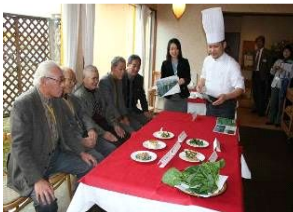
写真2 イタリア料理店との契約栽培

青年部については、様々な環境活動の中心部隊であるとともに、機械作業の専属オペレーターとして活躍する等、若い世代が確実に育成されている。