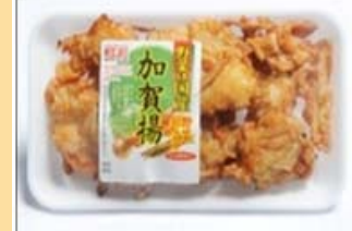
自社製品のパッケージ