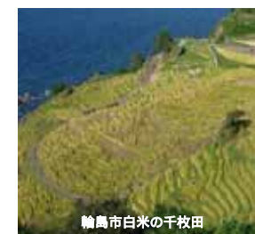
輪島市白米の千枚田

・平成23年6月11日に、石川県の能登地域と新潟県の佐渡地域が日本で初めて(先進国では初めて、世界で9番目)認定されました。