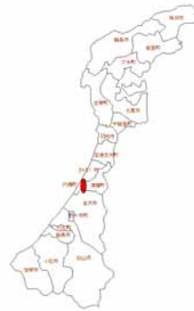
河北潟干拓地位置

干拓地での共同活動による農地保全や環境向上を図るため、農業者と非農業者、地域住民などの参加・支援による地域の発想や意向を反映した個性的な地域づくりを河北潟を中心に図ることとした。