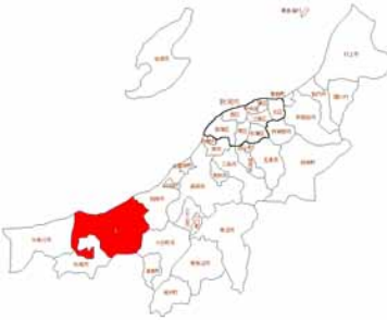
新潟県上越市位置

このため、高齢者の持つ能力を生かしたコミュニティ活動、特に女性や若者等の地域文化の伝承活動を促進し、若者から高齢者までの幅広い年齢層がいきいきとくらす地域づくりを図ることとした。