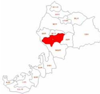
福井県越前市位置

本地区は、福井県越前市(旧今立町)にあり、地区の伝統産業である越前和紙や機織り・漆器などの体験ができる、本地区にしかない新たなグリーン・ツーリズムを模索してきた。特に平成15年度に試行した「田んぼのオーナー制度」をきっかけに、今立型エコ・グリーンツーリズムを推進するため平成16年には農家民宿に関する国の特区認可を受け、さらに『今立型エコ・グリーンツーリズム推進協議会(現口ハス越前)』を設立し、体制整備、民泊・体験受入の拡大など取組の強化を図ることとした。