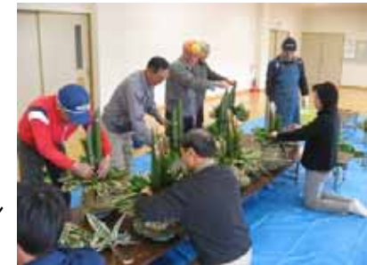
門松づくり体験研修

また、インストラクターも主体的な活動が芽生え始めており、相乗効果により地域コミュニティの活性化が促進されたため。