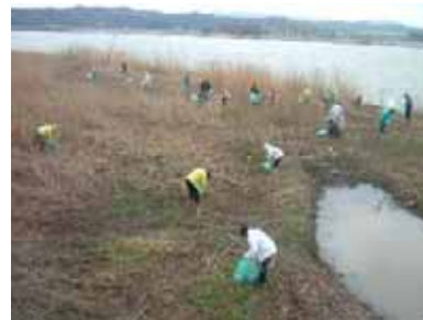
清掃活動の様子 (河北潟クリーン作戦)

平成17年度、石川県が「都市近郊農地多面的活用懇話会」を開き、継続的な地域活動を行う体制整備について検討を行い、農業農村整備事業により整備された基盤を発展的に利活用する、農業者、関係団体、ボランティア団体の環境美化活動や農業まつり等の地域活動に支援した。