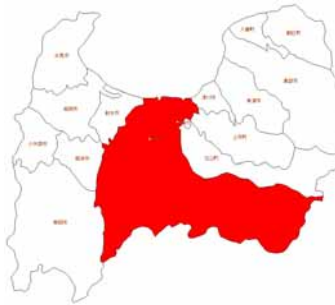
富山県富山市位置

さらなる営農基盤の拡大・営農活動の高度化のため、農道整備を行い、大型機械の通行改善と隣接地域からの農産物輸送についても便宜を図ることとした。