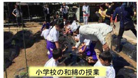
小学校の和綿の授業