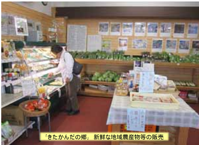
「きたかんだの郷」新鮮な地域農産物等の販売