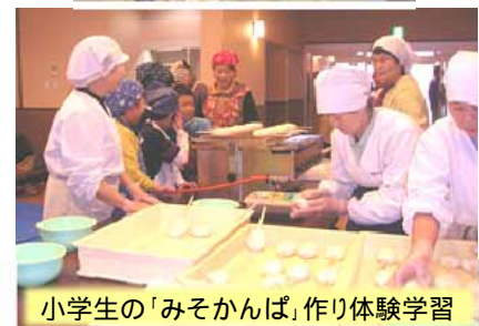
小学生の「みそかんぱ」作り体験学習