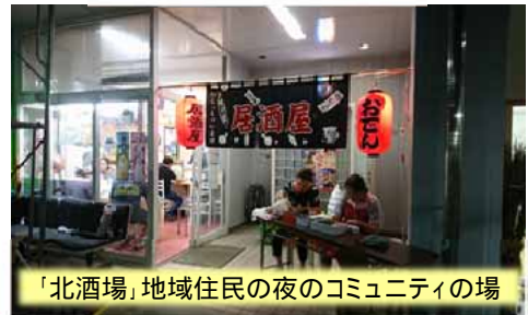
「北酒場」地域住民の夜のコミュニティの場