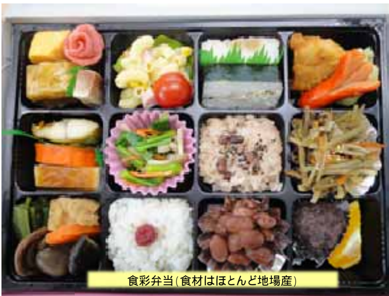
食彩弁当(食材はほとんど地場産)