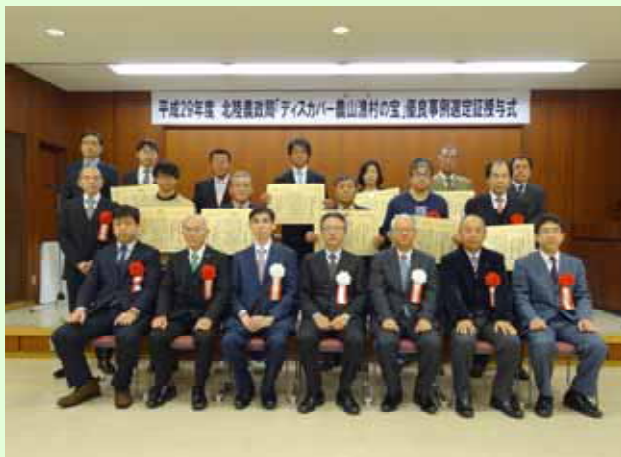
選定地区と局幹部との記念撮影

その後、会場を移し、授与式に出席された全国選定地区と北陸農政局選定地区の代表者と局内関係者が意見交換を行いました。