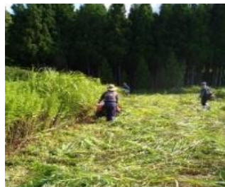
【農地・水路法面の草刈り】